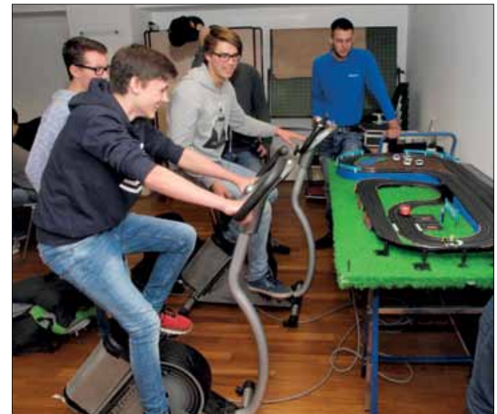
Der Schüleraktionstag mobilisiert Schülerinnen und Schüler aus der ganzen Region

Förderung und Qualifikation sind gerade am Beginn des Berufslebens wichtige Bausteine für den Erfolg. Das wissen die YoungProfessionals im VDE Rhein-Ruhr aus eigener Erfahrung. Dabei sind nicht nur technische Aspekte von Bedeutung, sondern auch die Förderung der „Soft skills“ sind zu berücksichtigen. „Mein Chef und ich, das geht gar nicht zusammen!“ – solche und ähnliche Themen werden dabei in einer Seminarreihe behandelt. Und mit Seminaren zu Themen wie „Schaltberechtigung in Mittelspannungsanlagen“ oder „Spannungsqualität und Netz-