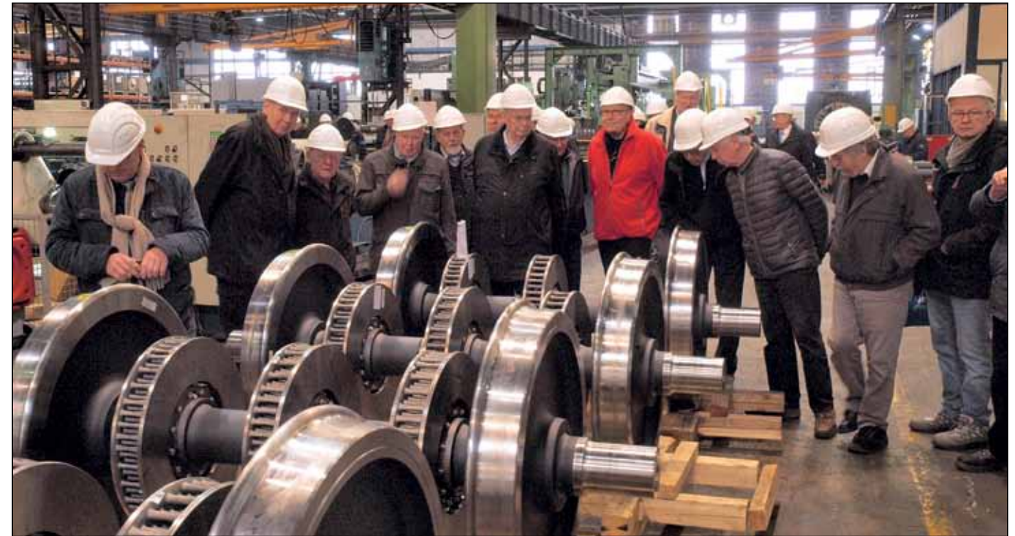
Die Seniorengemeinschaft bietet jedes Jahr ein abwechslungsreiches Programm

Vorträge, Seminare, Besichtigungen, Wissen wird im VDE Rhein-Ruhr auf unterschiedlichen Wegen geteilt. Dabei ist die Unterstützung der Mitglieder, per-