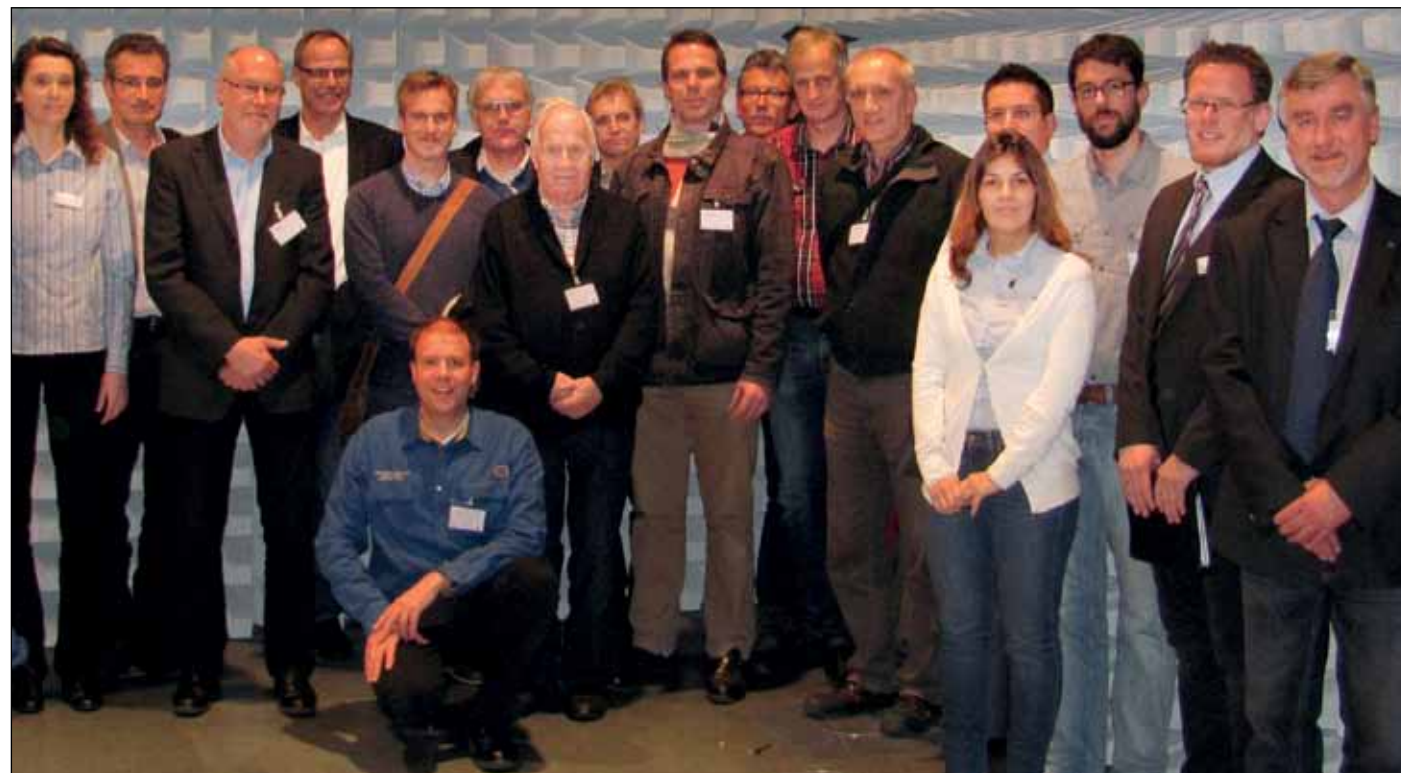
Der Arbeitskreis „CE-Kennzeichnung und EU-Richtlinien“ bietet mit best-practice-sharing eine wertvolle Plattform für einen angeregten fachlichen Austausch

reflektiert. Rund 3000 Mitglieder hat der VDE Rhein-Ruhr, 3000 Experten, 3000 Menschen mit einem technisch-wissenschaftlichen Hintergrund. Ein enormes Potential an Kreativität und Neugier, um gemeinsam Perspektiven zu erarbeiten und unseren Beitrag zu leisten – für die Zukunft unserer Region.