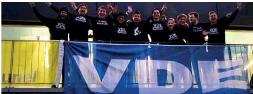
Die VDE-Hochschulgruppe Bochum - ein starkes Team

In Anlehnung an die Gebäudebezeichnung nennen sie den Termin „Ideen Sprudel“. Und die Ideen sprudeln in Bochum! Viel Raum nimmt dabei zur Zeit die Planung einer Großveranstaltung ein. Vom 22. bis 24. November richtet die HSG die nächste VDE-Jungmitgliederausschuss-Sitzung aus. Dazu werden ca. 80 Teilnehmer aus ganz Deutschland erwartet. Bewirtung, Vorträge und ein Rahmenprogramm müssen organisiert werden.