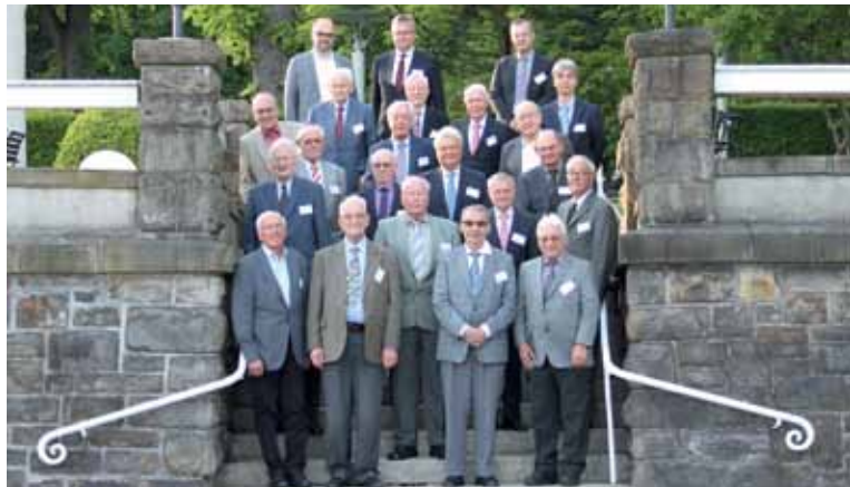
50 und 60 Jahre Vereinsmitglied