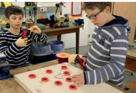
Engagierte Schüler bei der Arbeit

Der Technikpreis Wettbewerb des VDE Rhein-Ruhr, der zusammen mit dem Verband der Techniklehrer veranstaltet wird, ist zu einem festen Bestandteil im Veranstaltungskalender des VDE geworden. Jedes Jahr werden zehn Schülergruppen aus den Bewerbern ausgewählt, die dann mit einem Startkapital von 500 Euro ausgestattet werden, um ihr Projekt in die Tat umzusetzen. Auf Wunsch der Schülergruppen wird ihnen auch ein Mentor vom VDE zur Seite gestellt. Ich selbst bin seit vielen Jahren Mentor bei verschiedenen Schülergruppen gewesen. In diesem Jahr betreue ich die jüngsten Teilnehmer des Wettbewerbs: die Schülergruppe der Maristenschule aus Recklinghausen. Diese setzt sich aus Schülern der 5. und 6. Klasse zusammen. Die Rolle des Mentors ist hier nicht die Rolle eines Beraters - denn die Schüler haben meist schon eine klare Vorstellung von Ihrem Projekt und ihren Aufgaben. Vielmehr habe ich die Rolle eines Zuhörers, der sich von den Schülern ihr Projekt zeigen und erklären lässt.