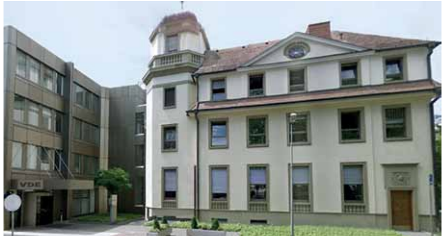
Das VDE Gebäude in Frankfurt ist auch Sitz der DKE

In der deutschen Elektroindustrie hat das Exportgeschäft einen Anteil von ca. 90% am Gesamtumsatz. Entsprechend ist die Arbeit der DKE international auf die IEC ausgerichtet und national mit grundsätzlich spiegelbildlicher Strukturierung der DKE-Normungsgremien – unter Berücksichtigung des CENELEC – organisiert. Rund 80% der Europäischen Normen entsprechen den Ergebnissen der IEC-Arbeit: Diese bedarfsorientierte Fokussierung auf die internationale Normung bildet gleichzeitig