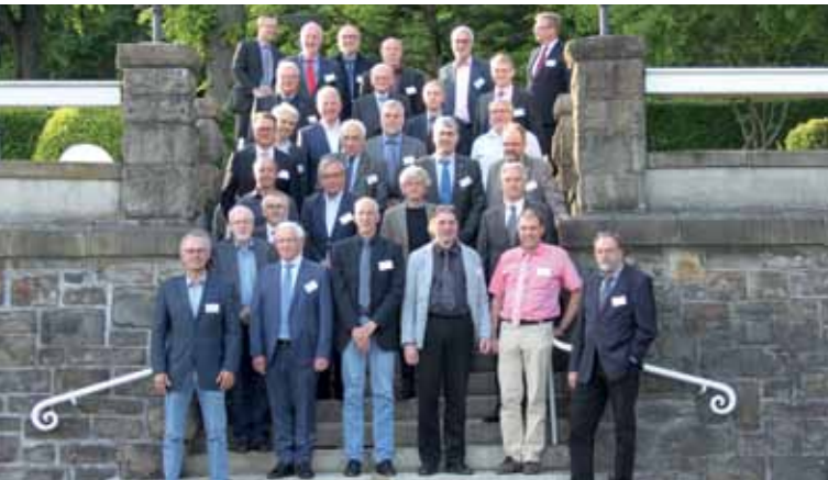
25 und 40 Jahre Vereinsmitglieder