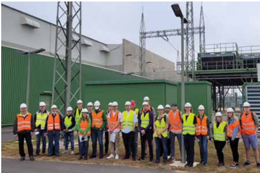
Studierende der HRW vor dem ALEGrO Konvertergebäude in Oberzier