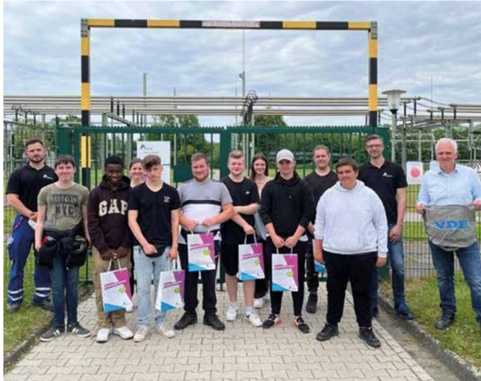
Schüler:innen der Hauptschule Husen in der Umspannanlage Wambel

Zum einen konnten Mitglieder der VDE Zweigstelle Essen/Gelsenkirchen und Studierende der Hochschule Ruhr West (HRW) die HGÜ-Konverterstation in Oberzier besichtigen. Sie bildet auf deutscher Seite den Endpunkt eines 90 km langen Gleichstrom-Erdkabels zwischen Deutschland und Belgien. Unter dem Projekt-namen ALEGrO (Aachen Lüttich Electricity Grid Overlay) können hier mittels Hochspannungs-Gleichstrom-Übertragung 1000 MW Leistung übertragen werden. An dieser Stelle danken wir insbesondere Frau Bouillon und Herrn Dr. Stumpe von Amprion für die Führung durch die Anlage.