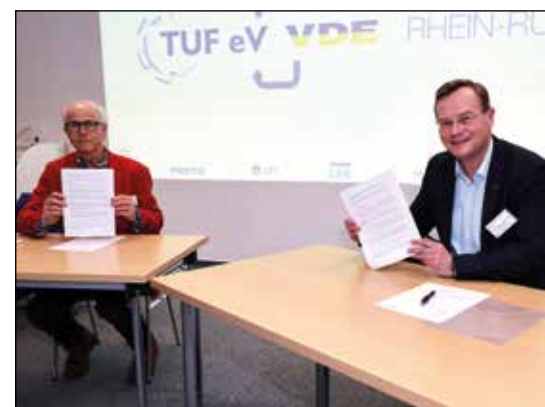
Unterzeichnung der Ausschreibung für den gemeinsamen Abiturpreis.

und der Gesellschaft Deutscher Chemiker - eine Lücke geschlossen, um zukunftsorientierte technische Bildung auch im Abiturbereich sichtbar zu machen.