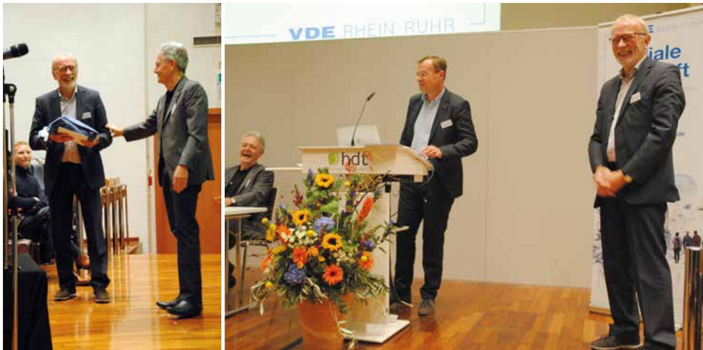
Die Ehrung auf der Mitgliederversammlung im Oktober 2021