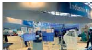
Stand des BMW auf der Hannover Messe 2015

zielt darauf ab, die deutsche Industrie in die Lage zu versetzen, für die Zukunft der Produktion gerüstet zu sein. Sie ist gekennzeichnet durch eine starke Individualisierung der Produkte unter den Bedingungen einer hoch flexibilisierten (Großserien-) Produktion. Die Produktion wird mit hochwertigen Dienstleistungen verbunden. Mit intelligenteren Monitoring- und Entscheidungsprozessen sollen Unternehmen