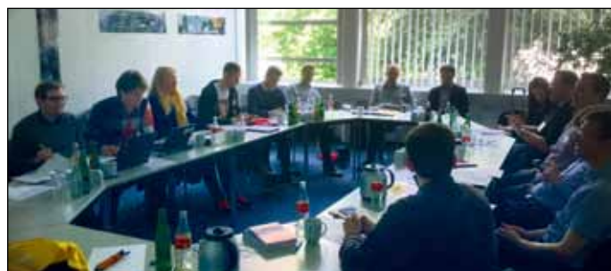
Intensive Arbeitsatmosphäre beim YPro-Forum in Düsseldorf

Forums besprochen wurde, war, wie sich die Zusammenarbeit zwischen den Hochschulgruppen und den YPros verbessern lässt. Weitere aktuelle Themen beinhalteten den strukturellen Umbau des VDE YoungNet, die Verbesserung der Werbung und die Vorstellung des neuen YoungNet Flyers. Berichtet wurde über die aktuelle Zusammenarbeit mit den Fachgesellschaften im VDE, den Aktivitäten der einzelnen Bezirksvereine und aus den Arbeitskreisen. Insbesondere die Vorbereitungen auf den