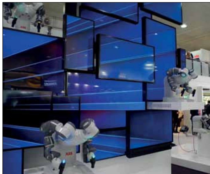
Der ABB Stand auf der Hannover Messe 2015

Führungen an dem Stand von ABB, den Hauptsponsor dieser Fahrt. Dabei wurden aktuellste Entwicklungen und Technologien des Konzerns vorgestellt, welche insbesondere in den Themenschwerpunkten „Smart Factory“ und „Industrie 4.0“ angesiedelt waren. Die Exkursion bot insgesamt allen Teilnehmern die Möglichkeit, einen Eindruck von innovativen Industriethemen zu bekommen. Ein herzlicher Dank geht an ABB für den Reisebus, die exklusiven Führungen, die Papiertüten mit kleinen Präsenten und die Eintrittskarten.